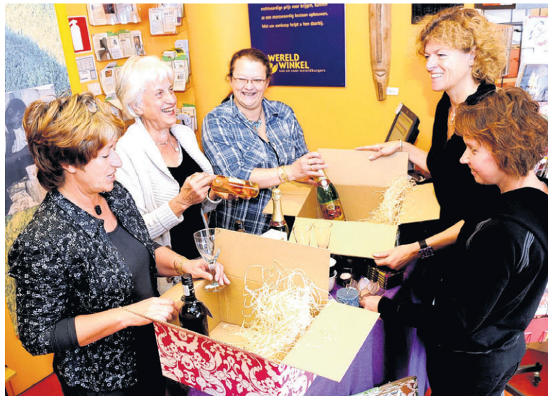
Kerstpakketten inpakken in Velp.

Doordat er in de Wereldwinkels met vrijwilligers wordt gewerkt, kan er een hogere prijs aan de producent worden betaald, en kan de winkel prijs op een normaal niveau worden gezet - zie hier de werking van de maatschappelijk-bewuste filosofie van